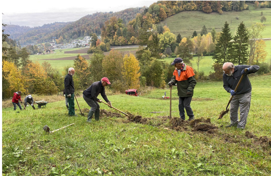
Helfereinsatz in der Erliweid.