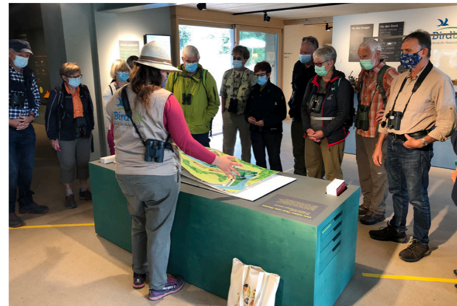
Oben: Trotz Corona konnten zwei spannende Kinder-Nachmittage stattfinden. Unten: Führung im BirdLife-Naturzentrum Klingnauer Stausee.

zu Fuss zum neuen BirdLife-Naturzentrum Klingnauer Stausee. Wir bekamen unter kundiger Leitung von zwei örtlichen Führerinnen einen Einblick in den Erlebnispfad und die Ausstellung. Am See beobachteten wir zahlreiche Zug- und Standvögel. Nach einem gemeinsamen Mittagessen im Restaurant Oase nahe des Naturzentrums ging es entlang des Sees durch das Auengebiet Gippinger Grien zum Bahnhof Koblenz (25 Personen).